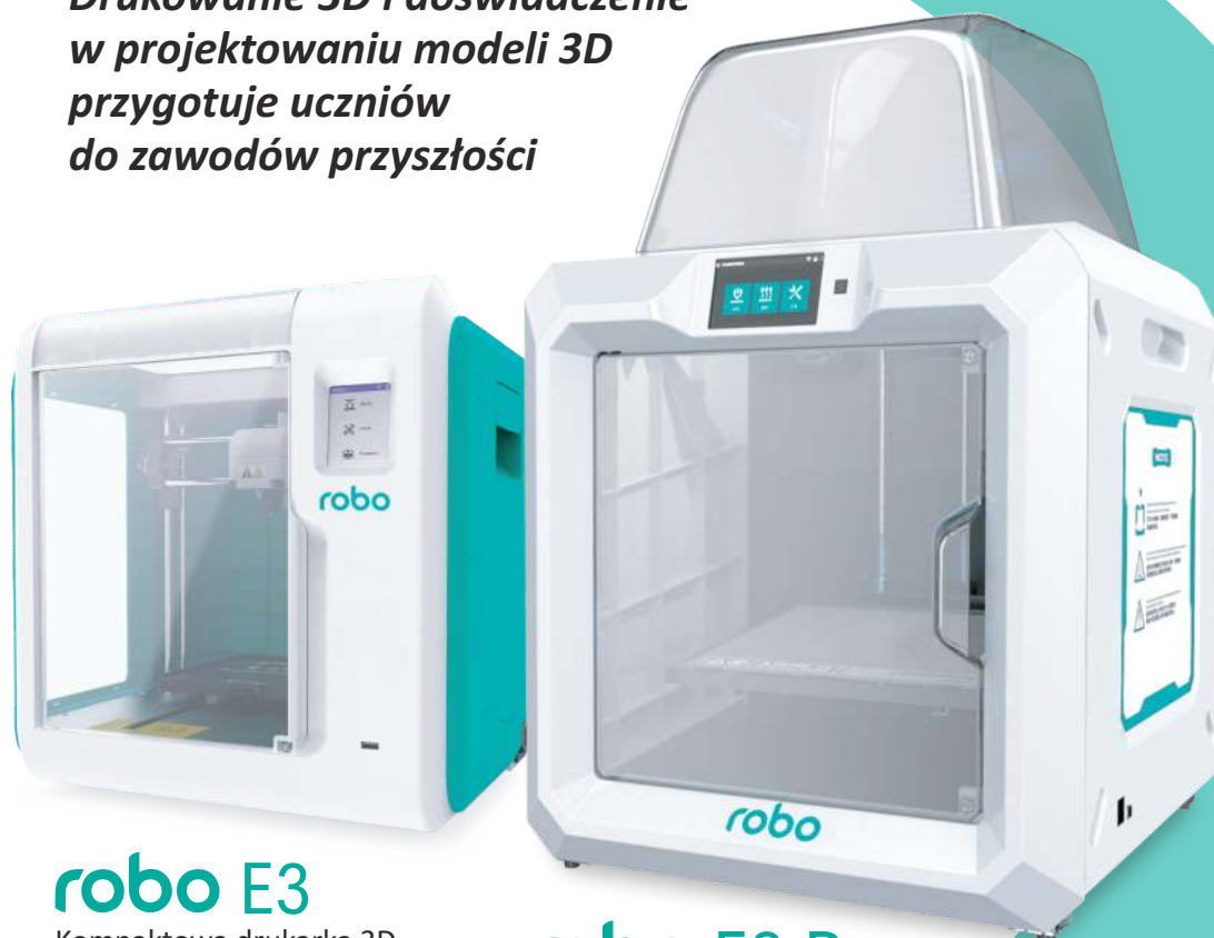
robo E3 Kompaktowa drukarka 3D

Drukowanie 3D i doświadczenie w projektowaniu modeli 3D przygotuje uczniów do zawodów przyszłości